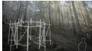
Porgel © Florian Gwinner / Skizze Sundial © Destroo & Morbi / Skizze Shapes of rain © Mori & Leboucher