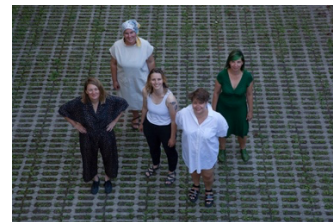
Vibra Alpina / Skizze Stifflerhupfn / Feldarbeiter*innen