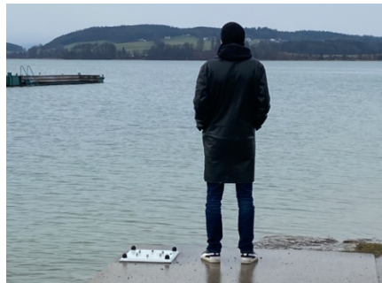
Künstlerresidenz März 2021