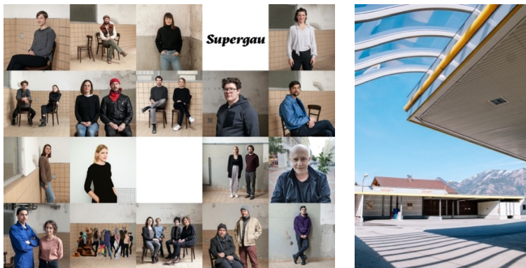
Supergau KünstlerInnen und Eni Tankstelle in Strobl